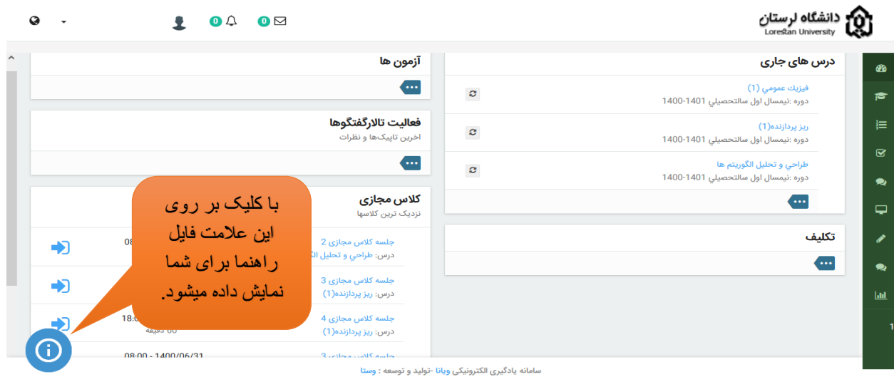
شکل شماره ۲

مرحله دوم: پس از ورود به سامانه ویانا در صفحه ی اصلی دو بخش دیده می شود. در قسمت "درس های جاری" با کلیک بر روی علامت بیشتر (سه نقطه) کليه درسهای اخذ شده در این نیمسال نمایش داده می شود. همچنین در قسمت "کلاس مجازی" با کلیک بر روی علامت بیشتر (سه نقطه) کليه کلاسهای مجازی به ترتیب اولویت زمان برگزاری نمایش داده می شود.